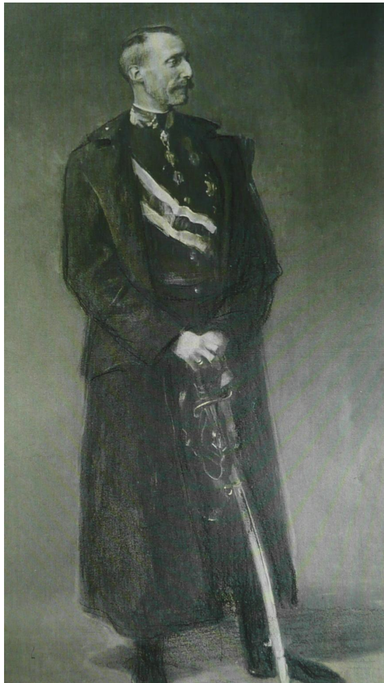
Portret arcyksięcia Karola Stefana Habsburga w mundurze jego piechoty