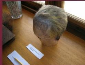
Eine Perücke aus der Burgtheater-Werkstatt

Die Kostüme und die Requisiten werden sorgfältig ausgesucht. Man verwendet meistens nur Perücken aus echten Haaren . Die Herstellung einer Perücke dauert oft zwei bis drei Wochen