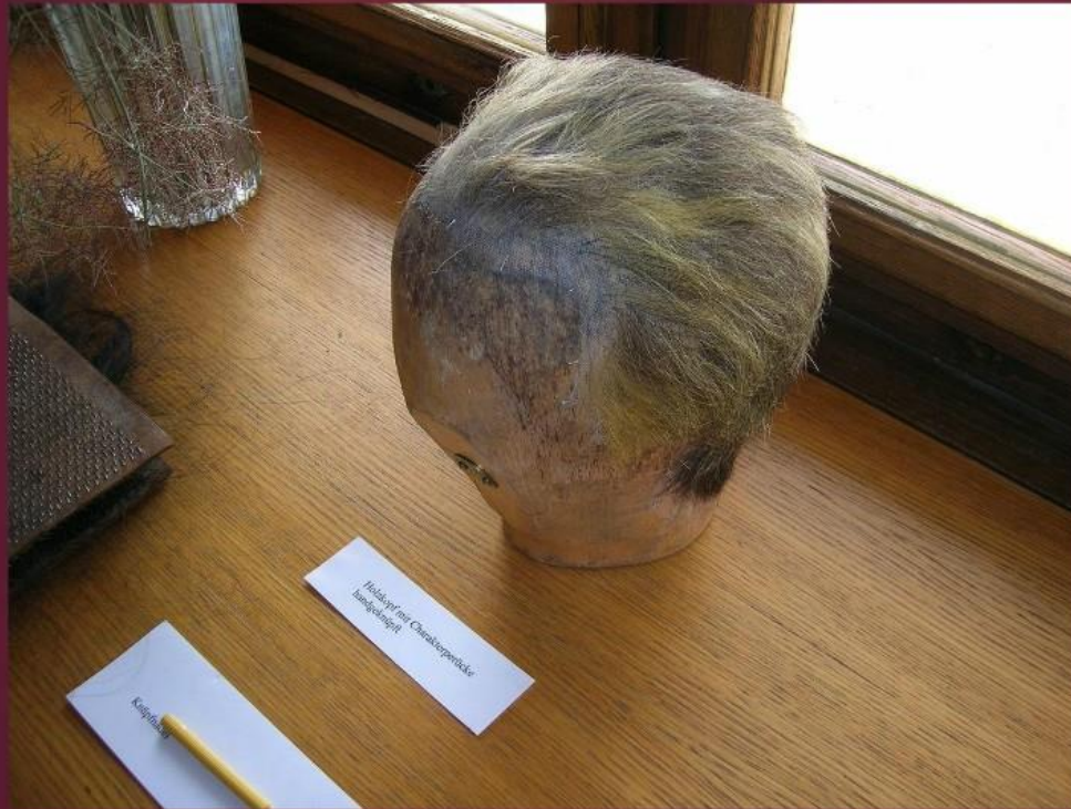
Eine Perücke aus der Burgtheater-Werkstatt